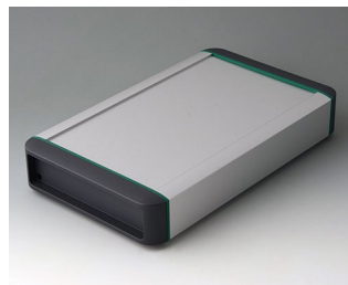
B3407031 SMART-TERMINAL 240 Алюминий AlMgSi 0,5 матово-анодированный 282x170x50mm IP 54