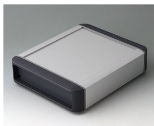
B3407012 SMART-TERMINAL 160 Алюминий AlMgSi 0,5 матово-анодированный 202x170x50mm IP 54