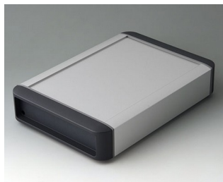
B3407022 SMART-TERMINAL 200 Алюминий AlMgSi 0,5 матово-анодированный 242x170x50mm IP 54