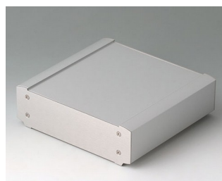
B3407013 SMART-TERMINAL 160 Алюминий AlMgSi 0,5 матово-анодированный 164x170x50mm