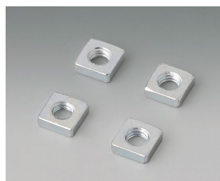
V3500001 Набор квадратных гаек М3 Сталь