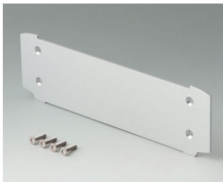
V3507025 Алюминиевая торцевая панель Алюминий матово-анодированный