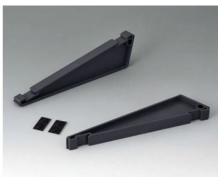
V3507030 Набор для наклона корпуса АСА+ПК-ФР (UL 94 V-0) лава