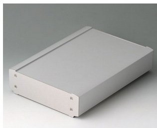
B3407033 SMART-TERMINAL 240 Алюминий AlMgSi 0,5 матово-анодированный 244x170x50mm