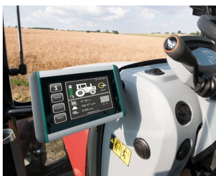
ISOBUS terminal for tractors and self-propelled machines