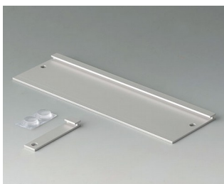
V3507020 Набор для настенного монтажа Алюминий