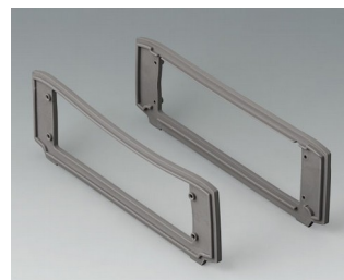
B3507017 Уплотнительные прокладки, серые TPV 50А вулкан