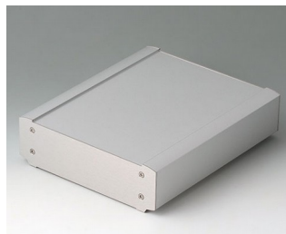
B3407023 SMART-TERMINAL 200 Алюминий AlMgSi 0,5 матово-анодированный 204x170x50mm