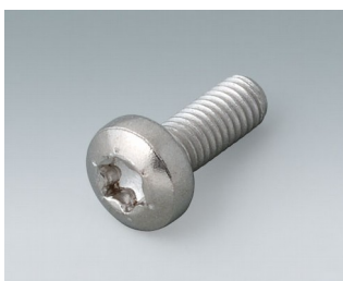
A0330080 Винт М3 х 8 (Т10) нержавеющая сталь