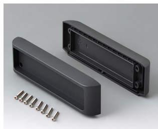
B3507011 Торцевые крышки АСА+ПК-ФР (UL 94 V-0) лава