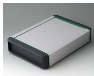
B3407021 SMART-TERMINAL 200 Алюминий AlMgSi 0,5 матово-анодированный 242x170x50mm IP 54