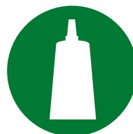
Установка / Сборка аксессуаров