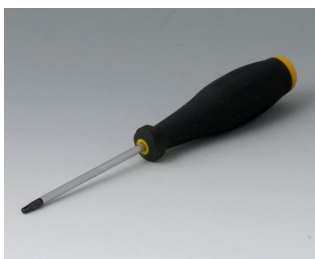
A0399T08 Отвёртка Torx T8

Возможно внесение изменений без предварительного уведомления. © by OKW Gehäusesysteme, Buchen/Germany.