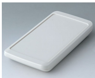
B5403307 SLIM-CASE M, исп. III ACA+ПК-ФР (UL 94 V-0) белый RAL 9002 148x74x19mm IP 65 opt., IP 40