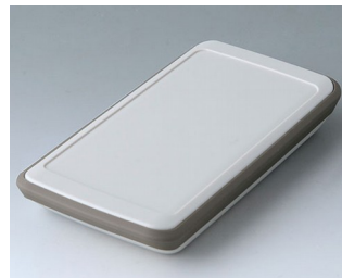
B5403217 SLIM-CASE M, исп. V ACA+ПК-ФР (UL 94 V-0) белый RAL 9002 148x74x22mm IP 54