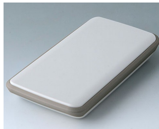
B5403117 SLIM-CASE M, исп. IV ACA+ПК-ФР (UL 94 V-0) белый RAL 9002 148x74x22mm IP 54