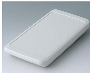
B5403207 SLIM-CASE M, исп. II ACA+ПК-ФР (UL 94 V-0) белый RAL 9002 148x74x19mm IP 65 opt., IP 40