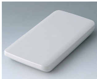
B5403107 SLIM-CASE M, исп. I ACA+ПК-ФР (UL 94 V-0) белый RAL 9002 148x74x19mm IP 65 opt., IP 40