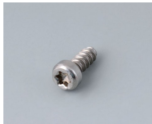
A0325060 Шуруп 2,5 x 6 мм (T8) нержавеющая сталь