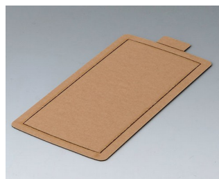
B5503300 Самоклеящаяся плёнка M