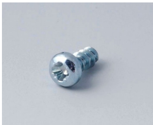
A0305031 Шуруп 2,5 x 6 мм (PZ1)