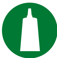
Установка / Сборка аксессуаров